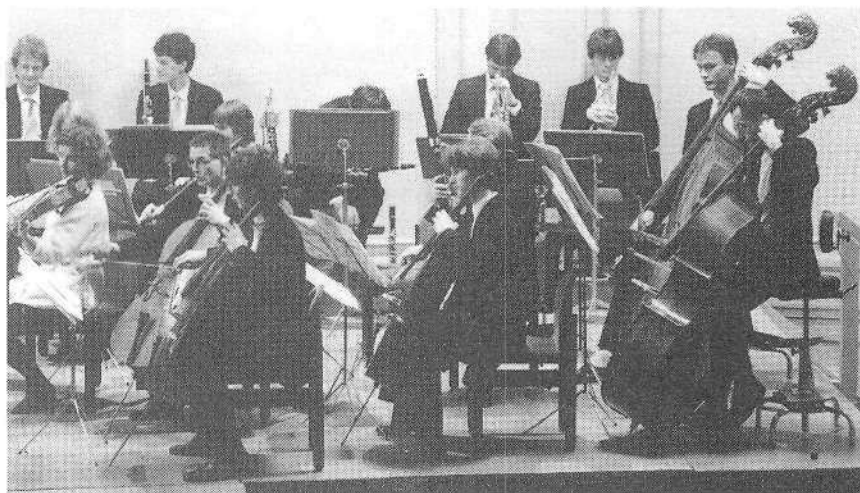
... in der Serenata Basel