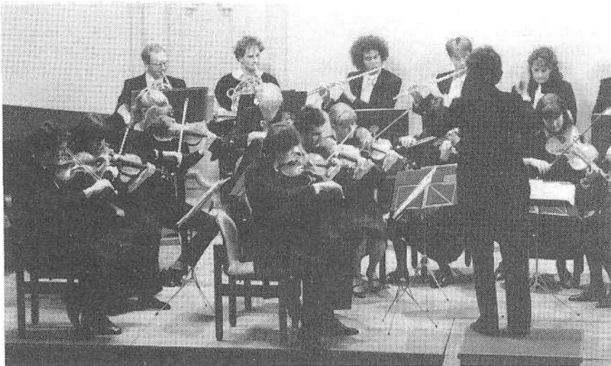
Grösserer Spass an der Orchestertätigkeit...

Ein erster Versuch – unter der Ägide eines grossen Unternehmens –, alle MusikerInnen zu bezahlen (Fr. 1400.– pro Mitglied für eine Tournée mit zehn Konzerten) brachte zwiespältige Erfahrungen. Einerseits erhöhten die vielen Auftritte das spieltechnische Niveau, die Sicherheit des Ensembles, andererseits führten ökonomisches Denken und die Anstrengungen der Tournée zu einer gewissen Kraftlosigkeit, Uninspiriertheit der musikalischen Aussage, also genau zum Gegenteil des Erhofften. Diese erste ernüchternde Erfahrung mit der Faktizität des Ökonomischen, aber