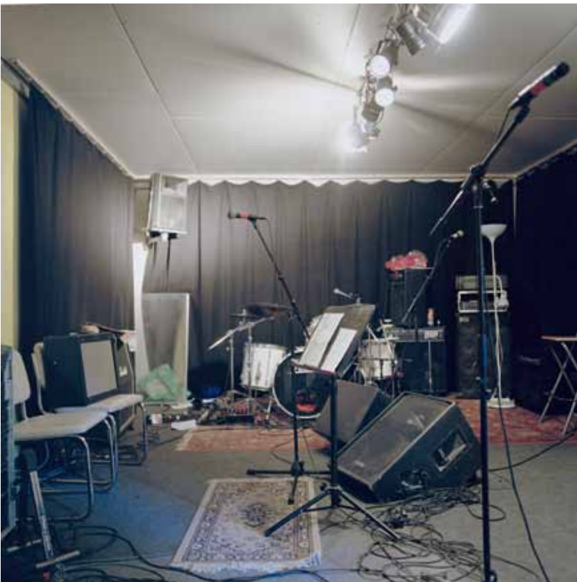
Oben: Konzertraum Jugend- & Kulturzentrum Gaskessel Bern, Sandrainstrasse 25, Bern; unten: Proberaum der Band SPAN, Ostermundigenstrasse, Bern.