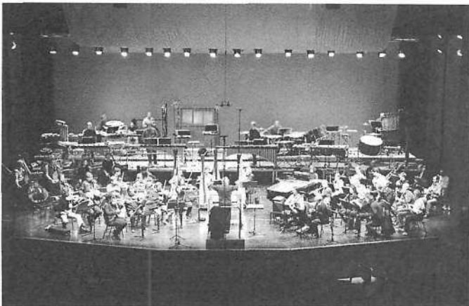
Pierre Boulez dirigiert die vereinigten Ensembles Collegium Novum Zürich, Contrechamps Genf und Phoenix Basel

Tage für Neue Musik Zürich (6.–9. November)